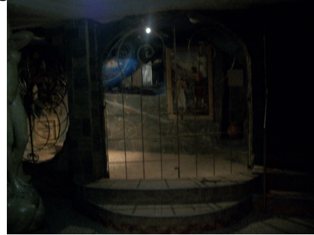
Foto 2. Cuarto donde se encontraba el aljibe.