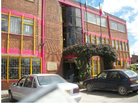
Foto 1. Fachada de el establecimiento Relikasa